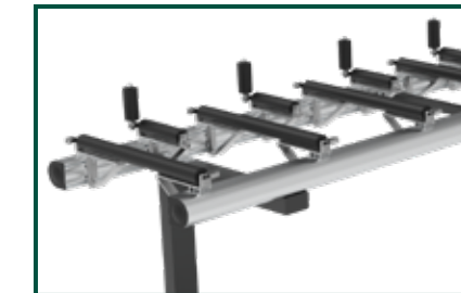
DETAIL DES PORTER XL

Rollenbahn Aufgabeseite mit Stangensammeltisch.